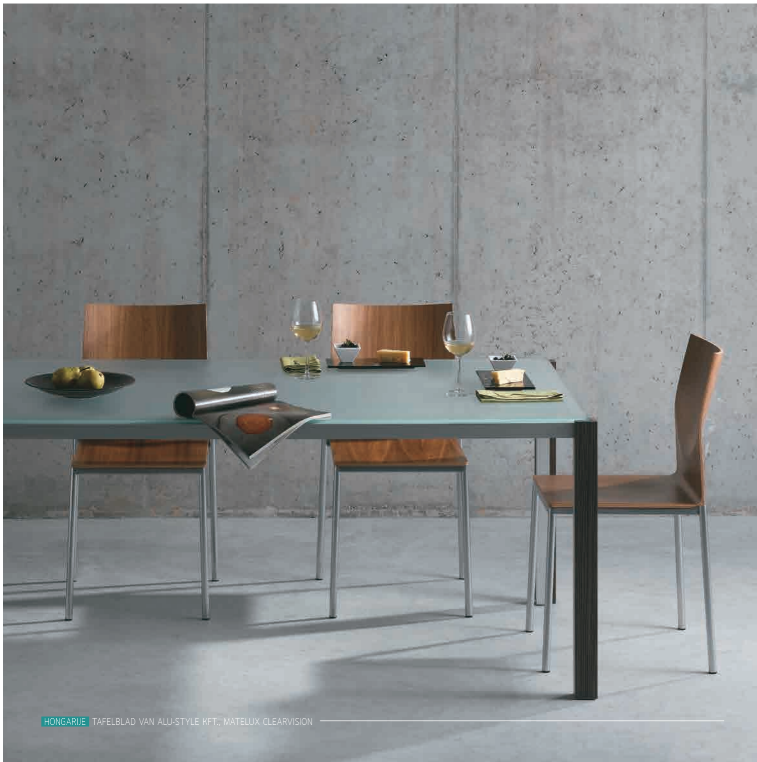
HONGARIJE TAFELBLAD VAN ALU-STYLE KFT., MATELUX CLEARVISION