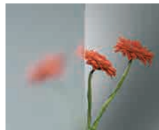
Clear Normaal floatglas