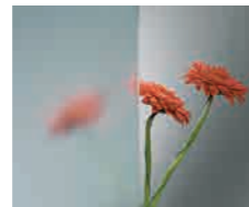
Linea Azzurra Licht blauw getint floatglas